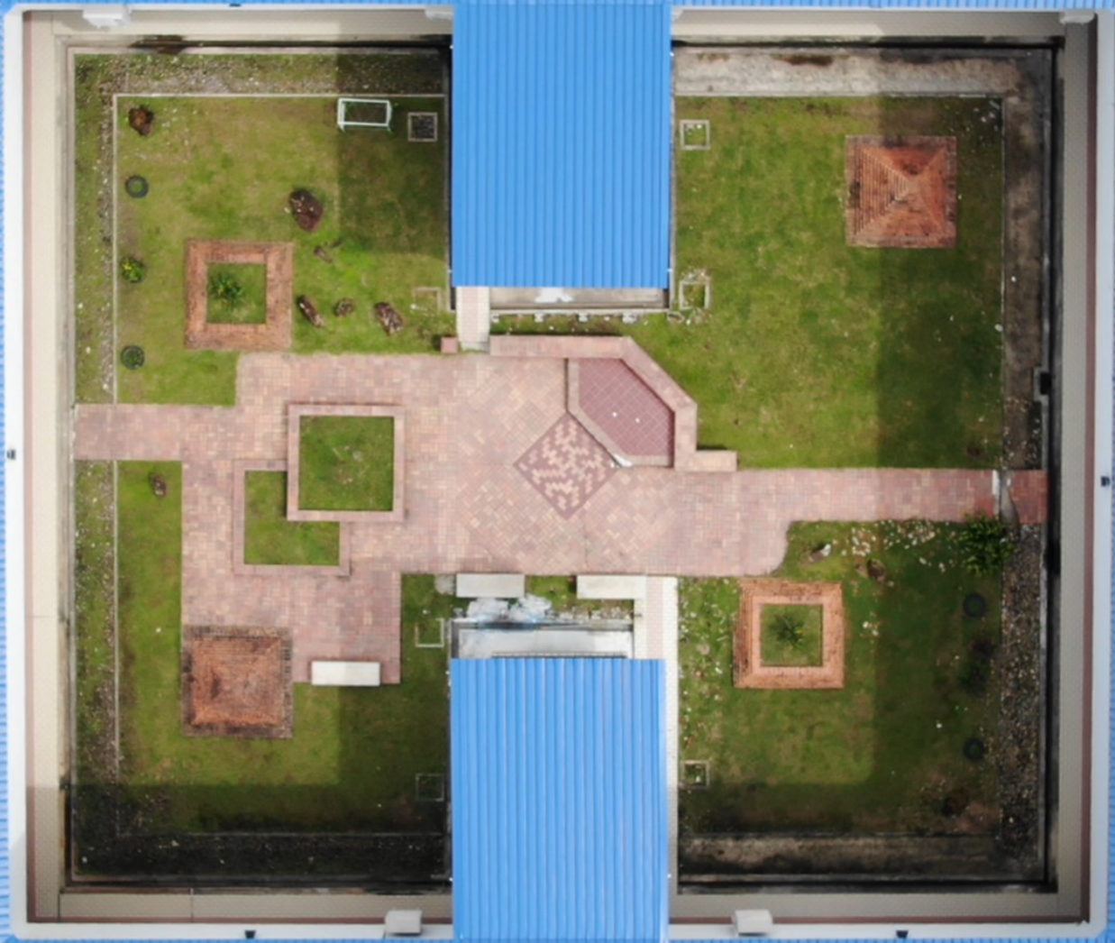
Foto: Rakaman drone dari udara di Pusat Kemajuan Pembelajaran & Inovasi IBTE Photo: Drone shot of IBTE Learning Advancement & Innovation Hub