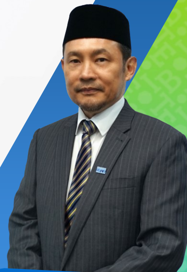
Dr. Haji Mohd Zamri bin Haji Sabli

Pelan Strategik IBTE 2019-2024 sebelum ini telah membawa IBTE ke arah perubahan yang ketara dengan membuahkan hasil yang mengagumkan. Namun, adalah sangat penting untuk mengekalkan momentum ini. Cabaran-cabaran yang dibawa oleh pandemik COVID-19 menekankan kepentingan kecekapan, daya tindak, kreativiti dan inovasi. Pengajaran dan iktibar yang diperolehi daripada pengalaman tersebut telah diintegrasikan ke dalam matlamat dan visi, bagi memastikan kita lebih bersedia untuk menghadapi cabaran masa depan.