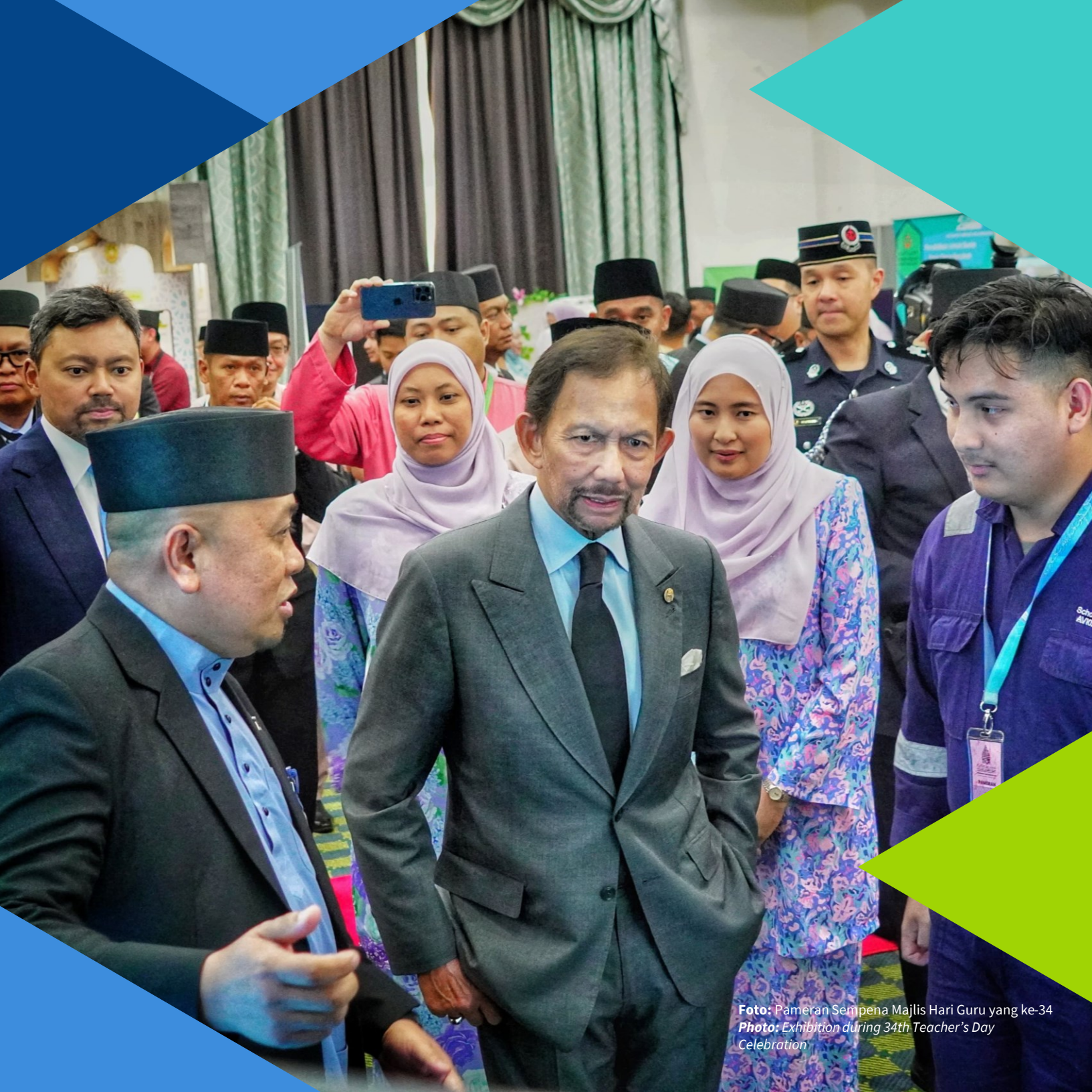
Foto: Pameran Sempena Majlis Hari Guru yang ke-34 Photo: Exhibition during 34th Teacher's Day Celebration